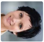
Pascale Bruderer-Wyss Consigliera degli Stati