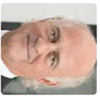
Klaus Endress Presidente del Consiglio di amministrazione del Gruppo Endress+Hauser