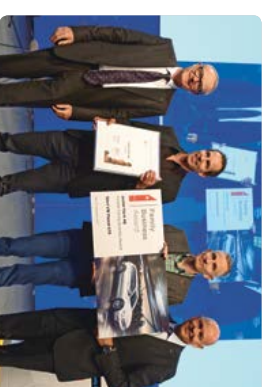
2017 Jucker Farm AG