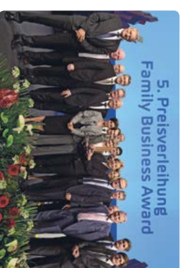
2016 FRAISA SA