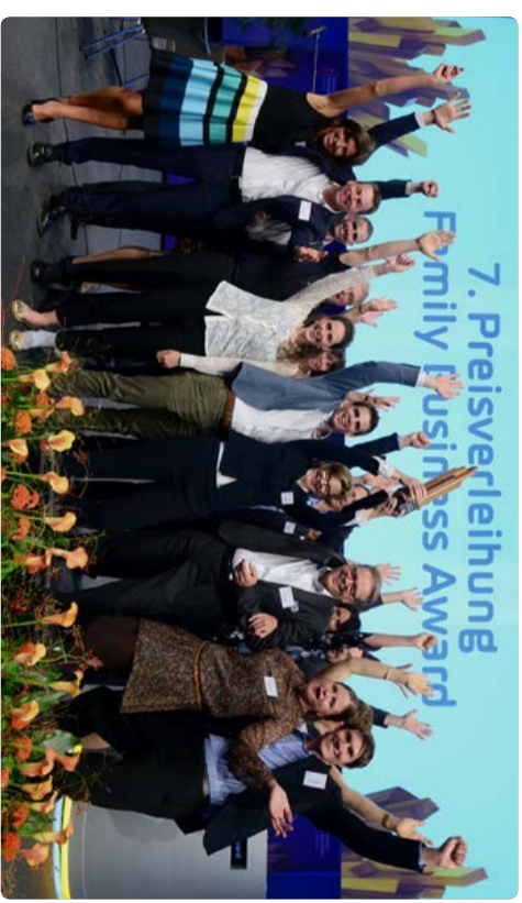
2018 1a hunkeler fenster AG & 1a hunkeler holzbau AG

Nel 2018 circa 60 interessati hanno presentato la propria candidatura per il Family Business Award. I dossier ricevuti sono stati esaminati da un'apposita giuria secondo una procedura sviluppata dal Centro per la sostenibilità e la responsabilità aziendale dell'Università di Zurigo (CCRS). Solo circa una ventina di candidati hanno raggiunto l'ultima selezione, dalla quale sono stati poi scelti tre finalisti. Il nome del vincitore per il 2018 è stato reso noto il 19 settembre 2018 nel corso della cerimonia di conferimento del premio tenutasi a Berna, alla presenza di esponenti del mondo dell'economia e della politica: il premio per l'imprenditorialità sostenibile e orientata ai valori è andato alla 1a hunkeler fenster AG & 1a hunkeler holzbau AG. Con la 1a hunkeler fenster AG & 1a hunkeler holzbau AG un'azienda esemplare va a completare la fila dei vincitori sinora designati del premio.